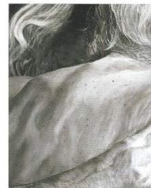
Zonder titel 115, 2011, acrylverf op doek, 100 x 60 cm